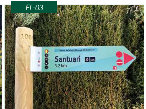
Flecha de placa de resinas con impresión en vinilo, vinilo corte o impresión por inclusión