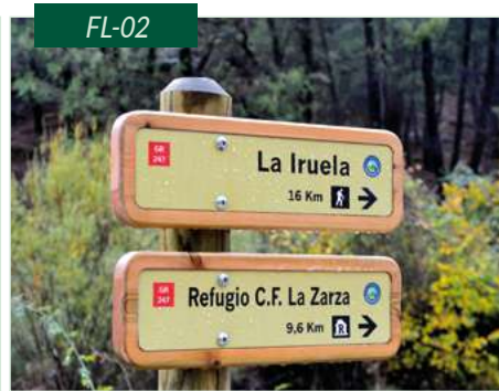
Flecha de madera con impresión en vinilo sobre aluminio-dibond