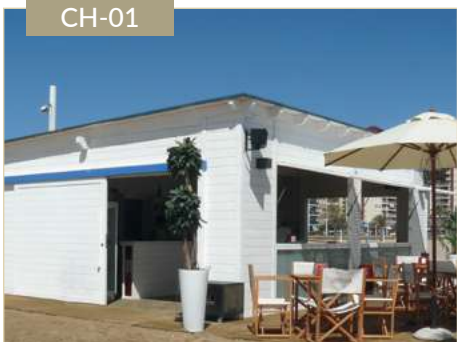
Chiringuito de playa