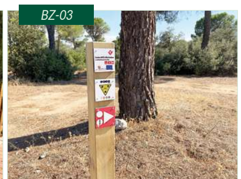
Baliza BTT / MTB