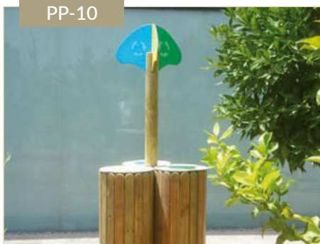
Papelera isla ecológica