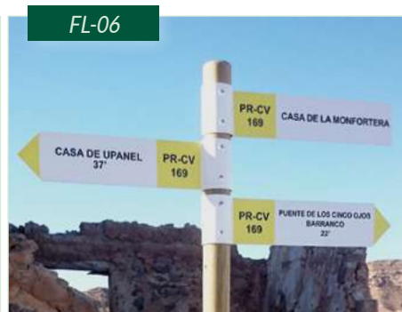
Flecha metálica con impresión en vinilo