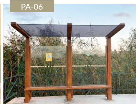
Parada de bus Boomerang