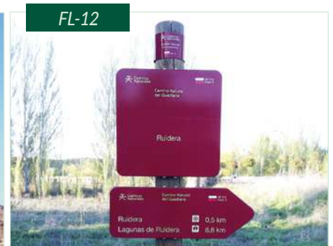
Flecha Caminos Naturales