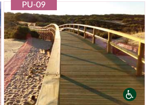
Pasarela Guardamar (accesible)

*Todas las pasarelas se pueden fabricar para que sean accesibles en silla de ruedas. Consultar.