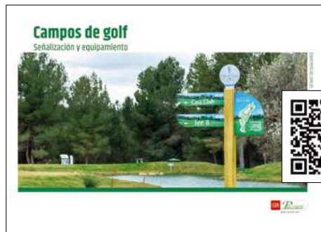
Señalización de Campos de Golf