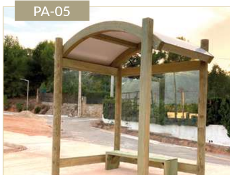
Parada de bus Ibiza