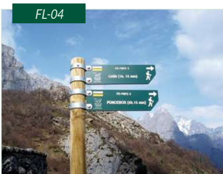
Flecha de placa de resinas con grabado en bajorrelieve