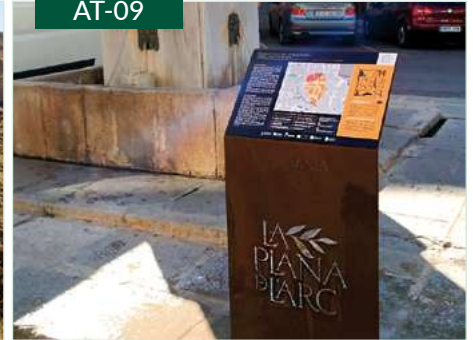
Atril interpretativo señalización turística peatonal

*Todos los productos pueden incorporar lenguaje Braille y altorrelieve para garantizar la accesibilidad.