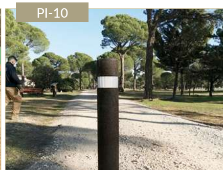
Pilona reflectante circular de plástico reciclado