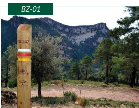
Baliza de sendero redonda