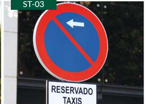
Señal metálica de tráfico urbana