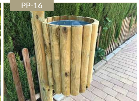
Papelera de madera económica