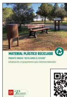
Catálogo de material plástico reciclado