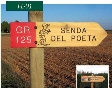
Flecha de madera con grabado en bajorrelieve