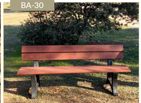
Banco Perpignan en plástico reciclado