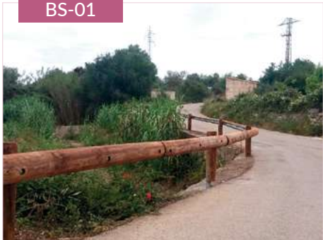
Barrera de seguridad homologada para carreteras