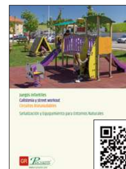
Catálogo de juegos infantiles