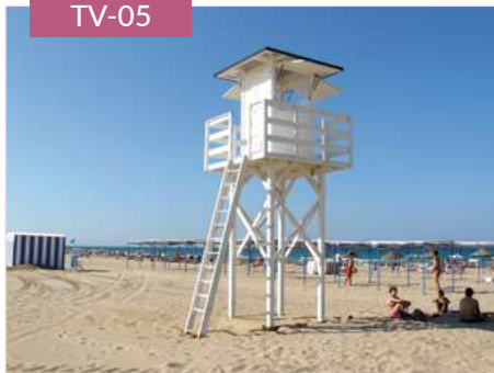
Torre de vigilancia para playa