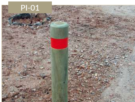
Pilona en madera