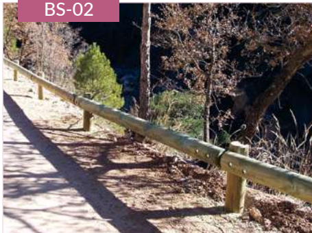
Barrera mixta para protección de caminos