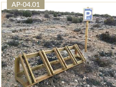
Aparcabicis de madera cuadrado