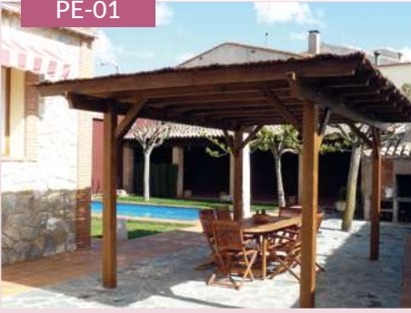
Porches y pérgolas un agua