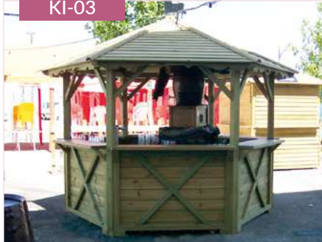
Kiosco bar hexagonal