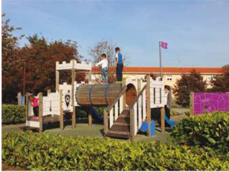
Conjunto juegos infantiles