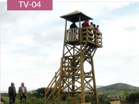
Torre de vigilancia completa con plataforma