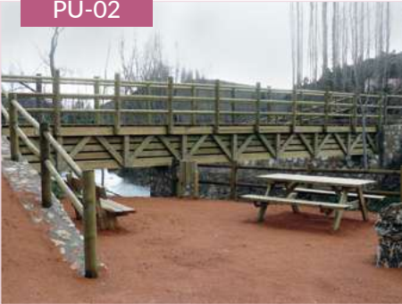
Puente de postes cuadrados