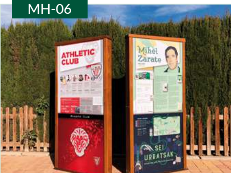
Tótem metal-madera ciudad