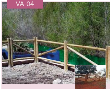
Valla San Andrés