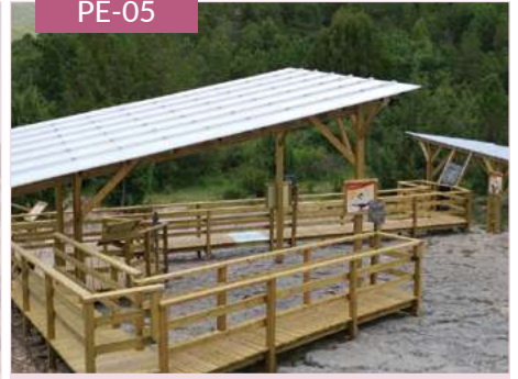
Pérgola cubierta translúcida