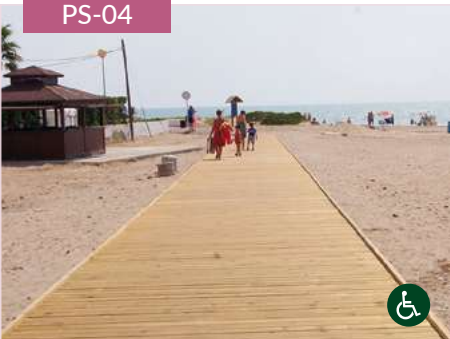
Pasarela de playa rígida