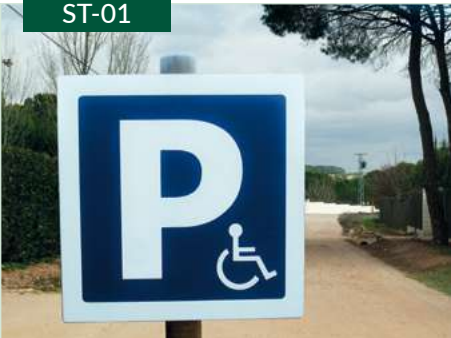
Señal de tráfico de madera con grabado en bajorrelieve