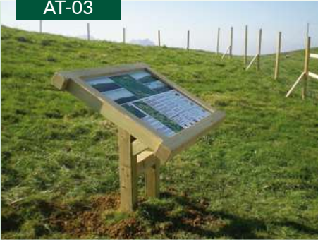
Atril de madera enmarcado