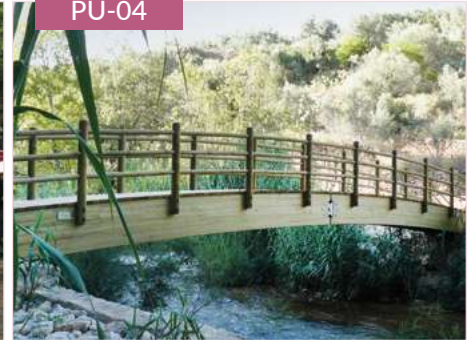
Puente curvo postes redondos