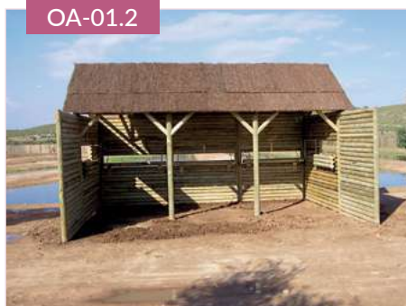
Observatorio de rollizo refugio -dos aguas