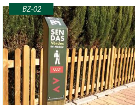
Baliza de sendero cuadrada