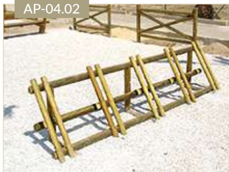
Aparcabicis de madera redondo