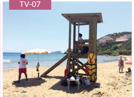
Torre de vigilancia Ibiza