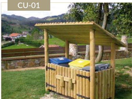
Cubrecontenedor con tejadillo