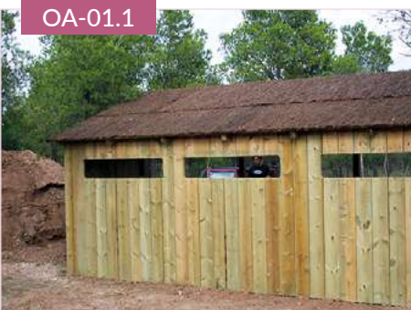
Observatorio de tabla refugio -un agua