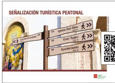
Señalización turística peatonal