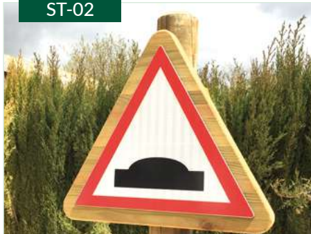
Señal de tráfico de madera con impresión en aluminio-dibond