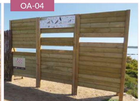
Observatorio de aves pantalla