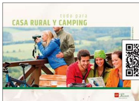
Todo para casas rurales y camping