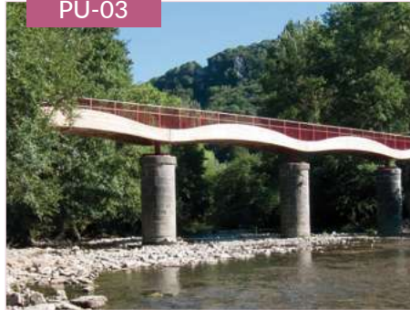
Puente peatonal mixto madera-metal