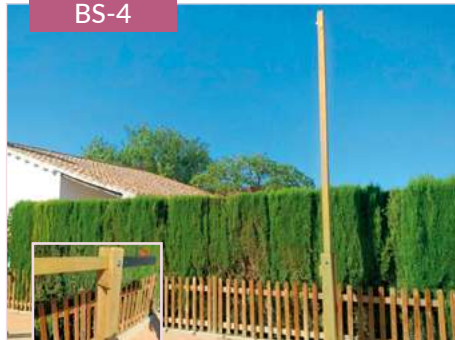
Barrera de acceso madera