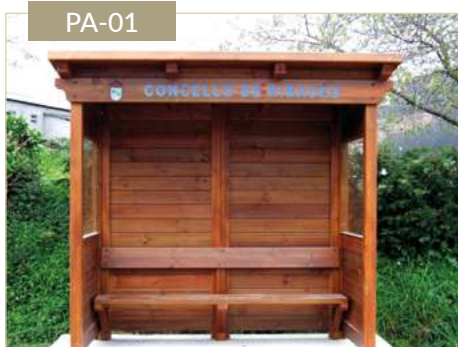
Parada de bus Proarte