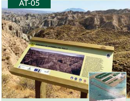
Atril de Espacios Naturales de Andalucía