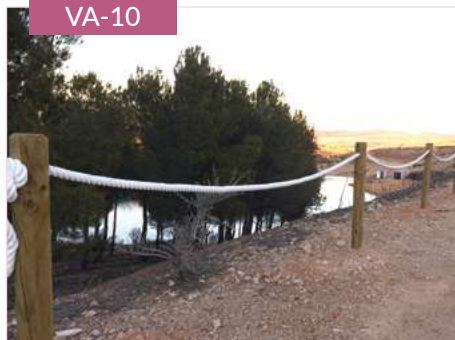
Vallado con cuerda